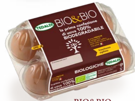
BIO&BIO NEGOZI SPECIALIZZATI